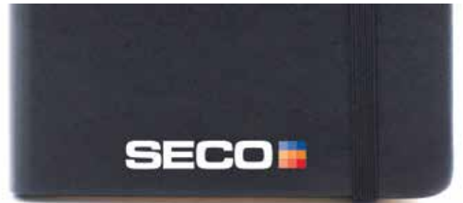
Serigraf boya baskı