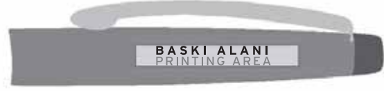
4mm x 30mm