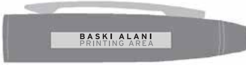
5mm x 30mm

Baskı yapılacak logo, en-boy oranıtısı bozulmadan büyütülmesi gerektiği için logonun alt ve üst hizadan yüksekliđi belirleyicidir.