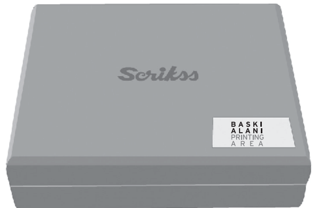
LASER BASKI / Ahşap kutu